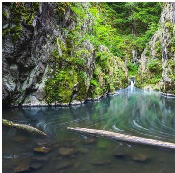
Vyhledávané místo uměleckými fotografy

Skryjská jezírka jsou dvě malá jezírka na rozhraní okresů Rokycany v Plzeňském kraji a Rakovník ve Středočeském kraji v České republice. Leží v nadmořské výšce 270m. Jezírka jsou od sebe vzdálená jen několik metrů a každé z nich má délku přibližně 30m, šířku 10m a plochu asi 150m 2 . Přírodní rezervace Jezírka o celkové rozloze 60ha se z větší části nachází na území Středočeského kraje (pouze západní částí zasahuje do kraje Plzeňského) a je v péči AOPK ČR – regionálního pracoviště Střední Čechy.